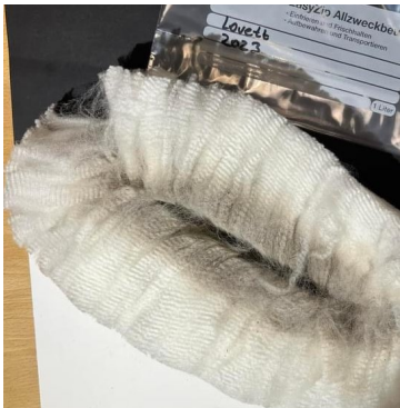
8. Fleece von seiner Mutter