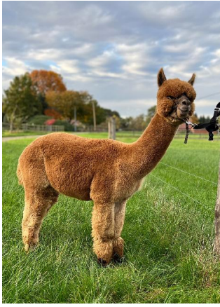
Alpaka Foto 2