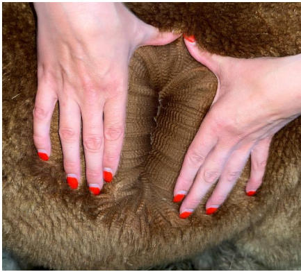
Alpaka Foto 3