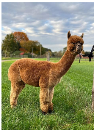
Alpaka Foto 2