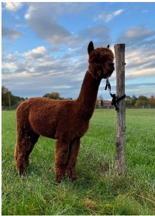
Alpaka Foto 2