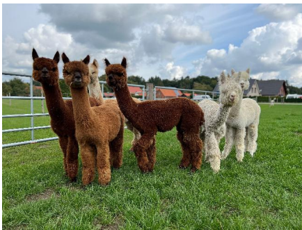
Alpaka Foto 3