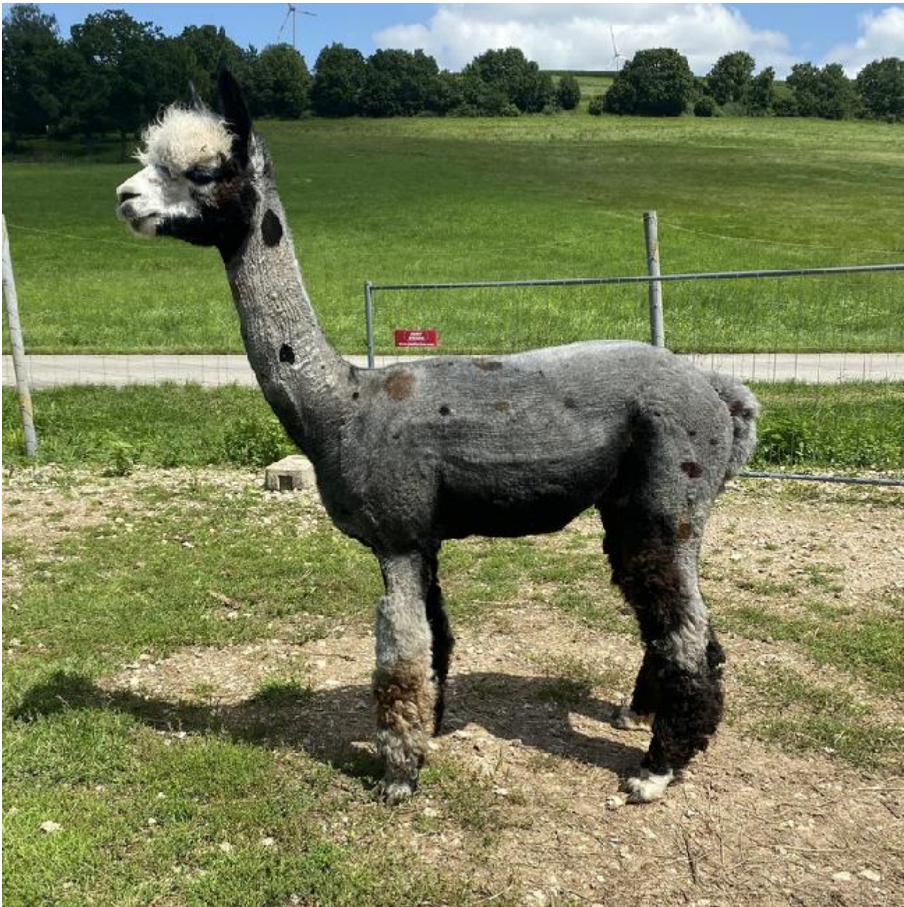
Alpaca Photo 1