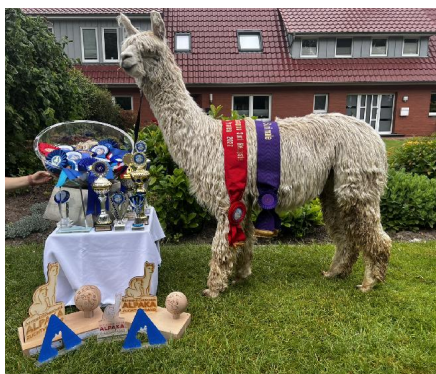
Alpaka Foto 3