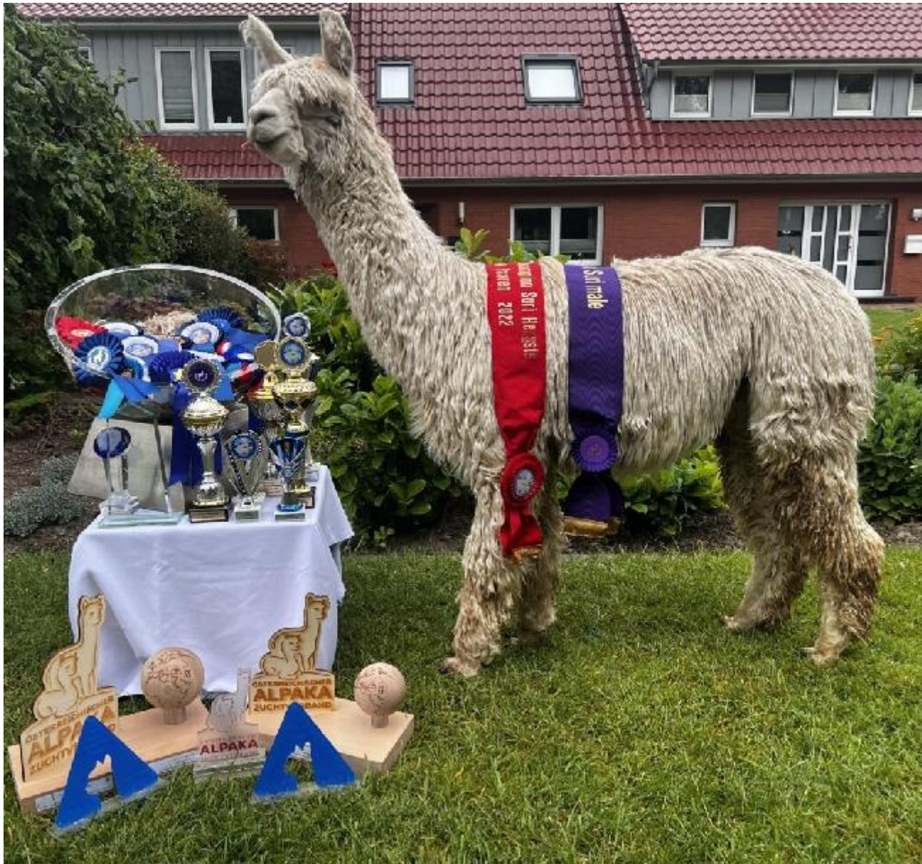
Alpaka Foto 1