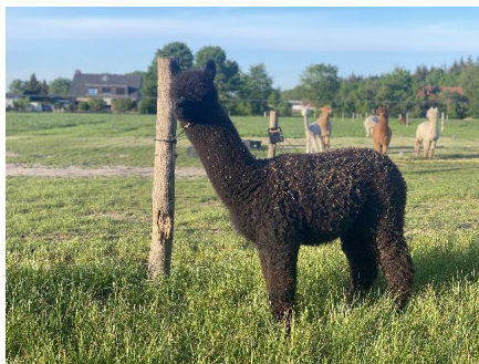
Alpaka Foto 1