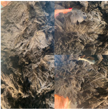
Alpaka Foto 3