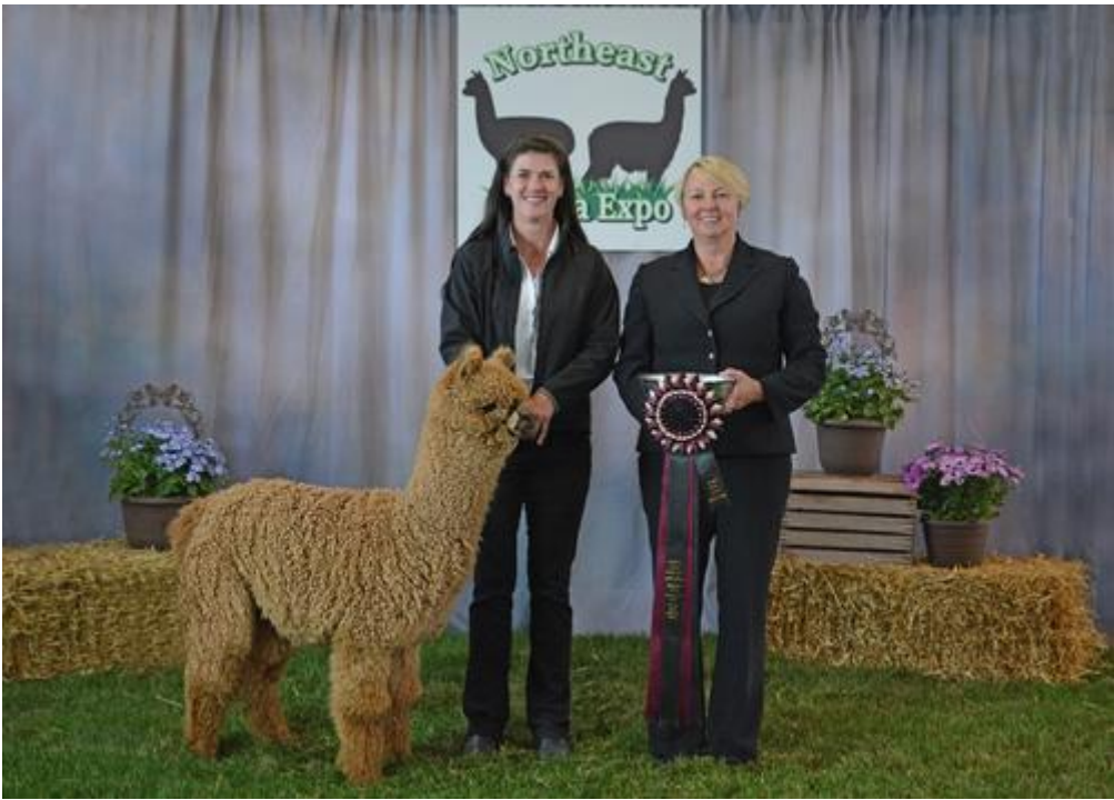
Judge's Choice 2015 Northeast Alpaca Expo