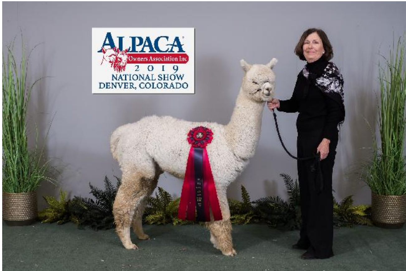
Alpaca Photo 1