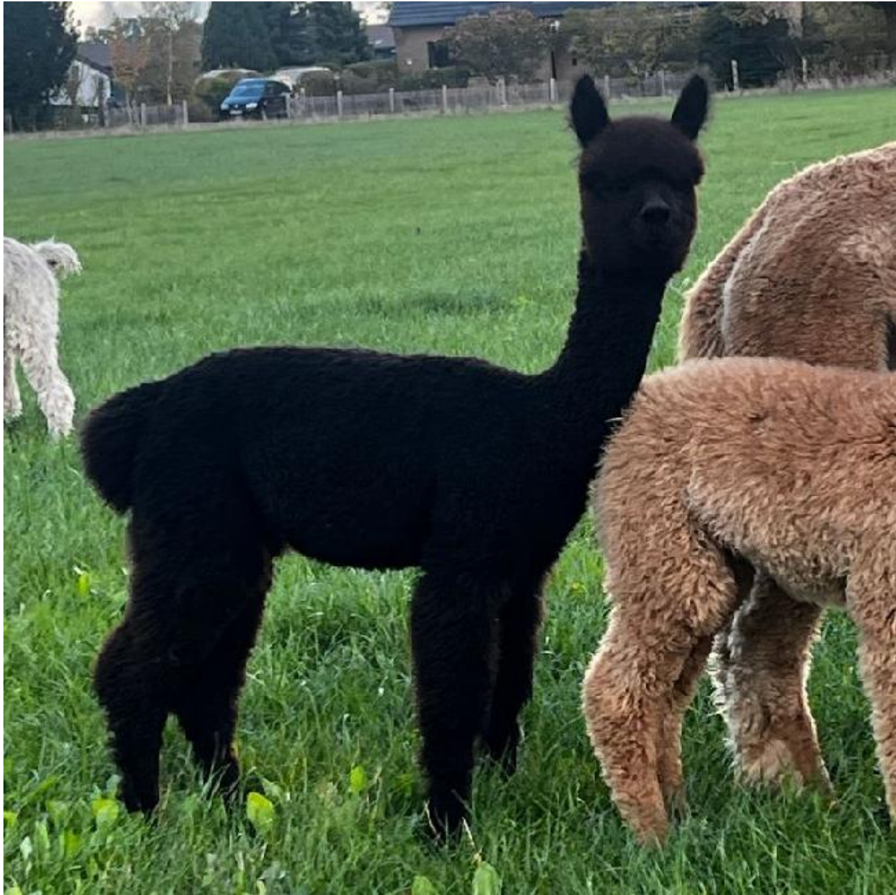
Alpaka Foto 1

hat und damit ein Garant für dunkle feine, gleichmäßige Nachkommen mit einem tollen Typ wäre.