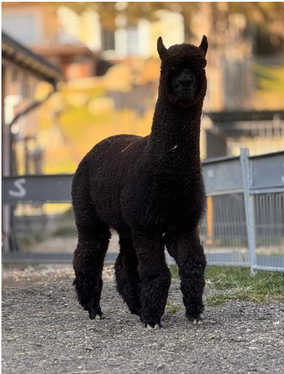
Alpaka Foto 1