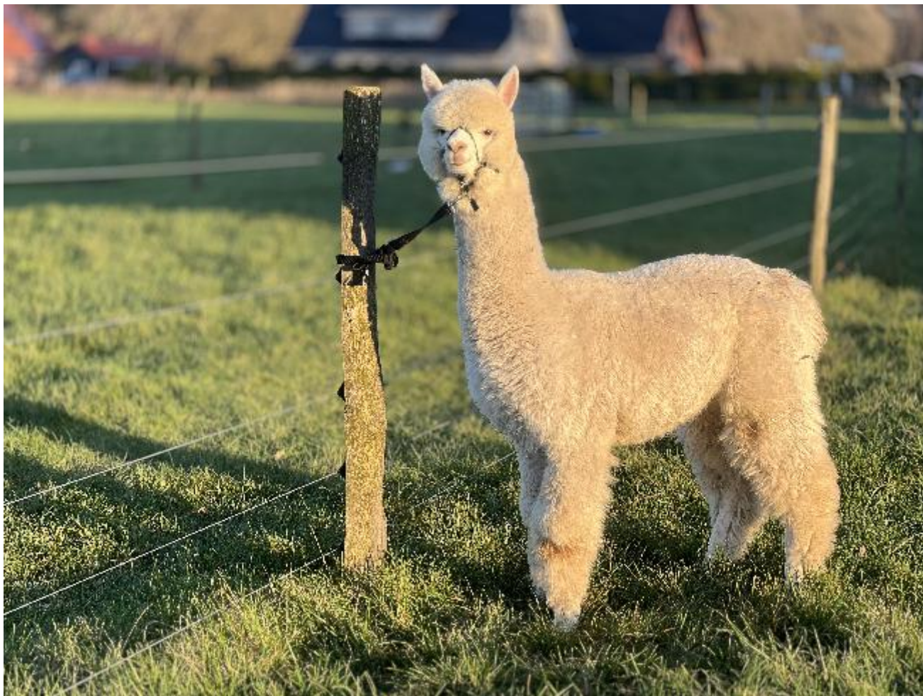
Alpaca foto 1