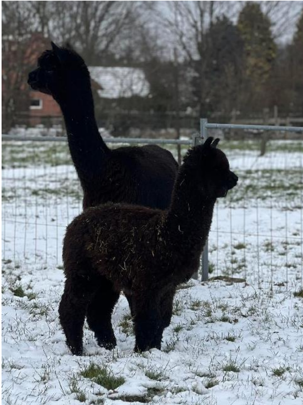
Alpaca foto 1

Verwachte geboortedatum (Drachtige merrie): 28/02/2026