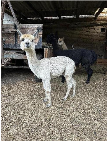
Alpaca Photo 3