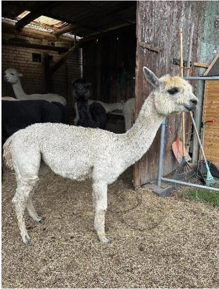
Alpaca Photo 2