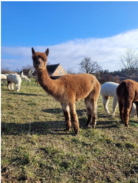
Alpaka Foto 2