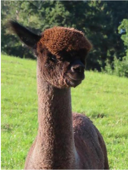
Alpaka Foto 2