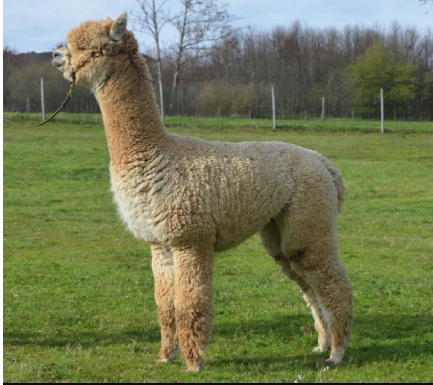
Alpaca Photo 2