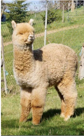
Alpaca Photo 3