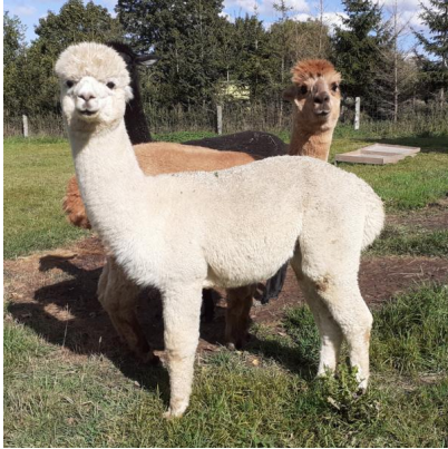
Alpaka Foto 2