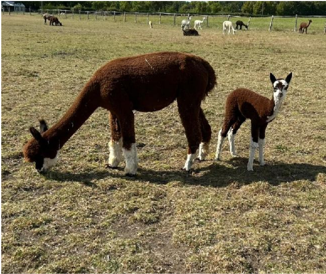
Alpaka Foto 1