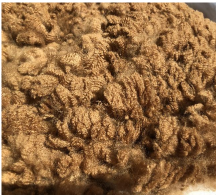
Alpaca Photo 3