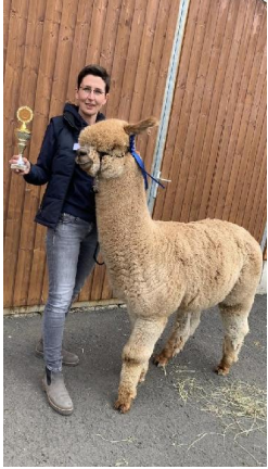
Alpaca Photo 2