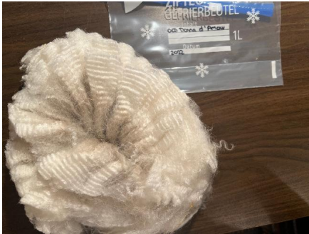
Alpaka Foto 3