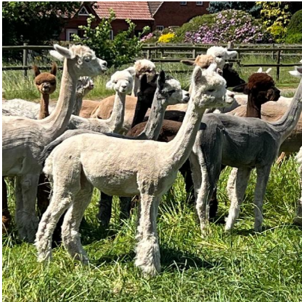
Alpaka Foto 2