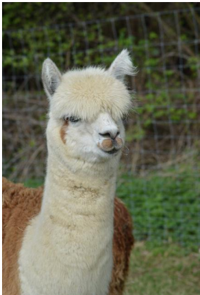
Alpaka Foto 3