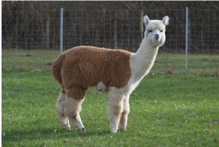
Alpaka Foto 2