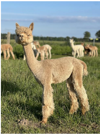
Alpaka Foto 2