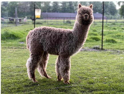
Alpaka Foto 3