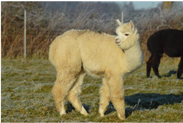
Alpaka Foto 2