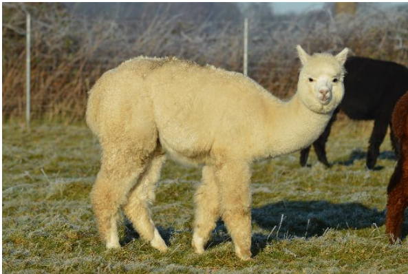
Vater TOOTA Appaloosa Eternal Flame