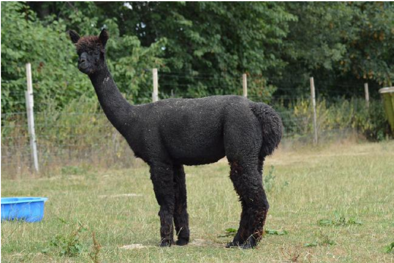
Alpaka Foto 1