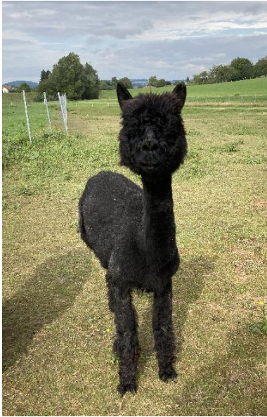
Alpaka Foto 2