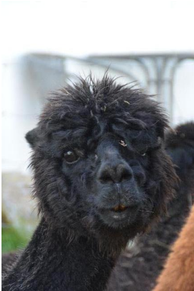
Alpaka Foto 3