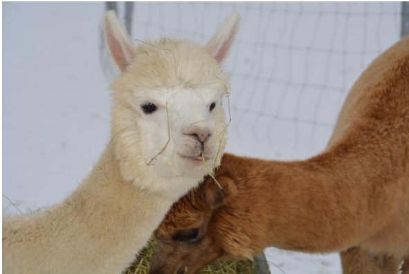
Alpaka Foto 3