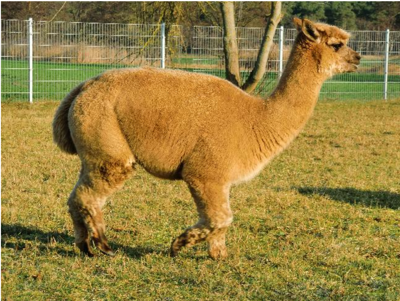
Alpaca Photo 1