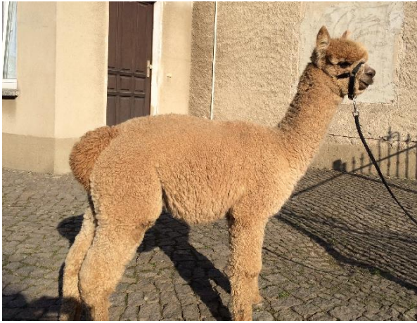
Alpaca Photo 3