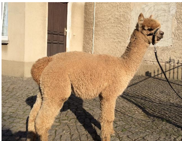
Alpaka Foto 3