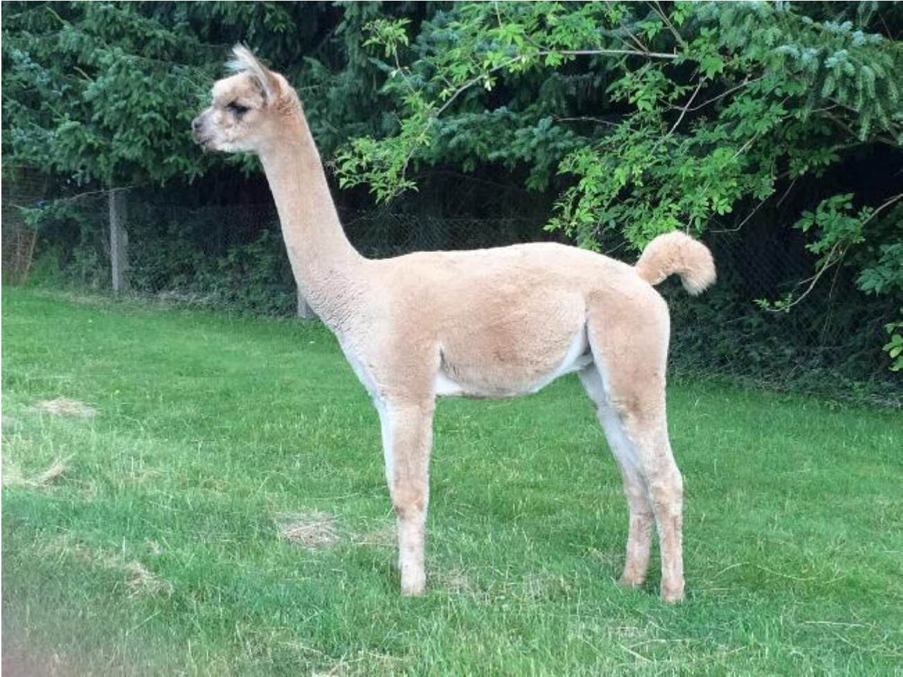
Alpaca Photo 1