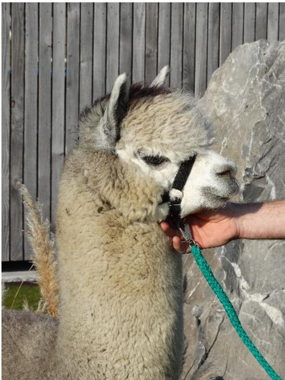
Alpaka Foto 1