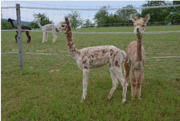
Alpaka Foto 3